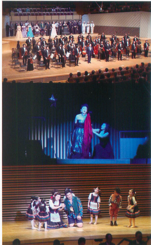
第70回記念演奏会『魔笛』の模様